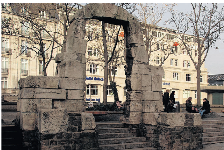
Poort in de Romeinse stadsmuur.

tekst JOOST VERMEULEN, foto's RÉNIE VAN DER PUTTE