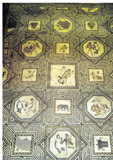
Romeins mozaïek in het museum.