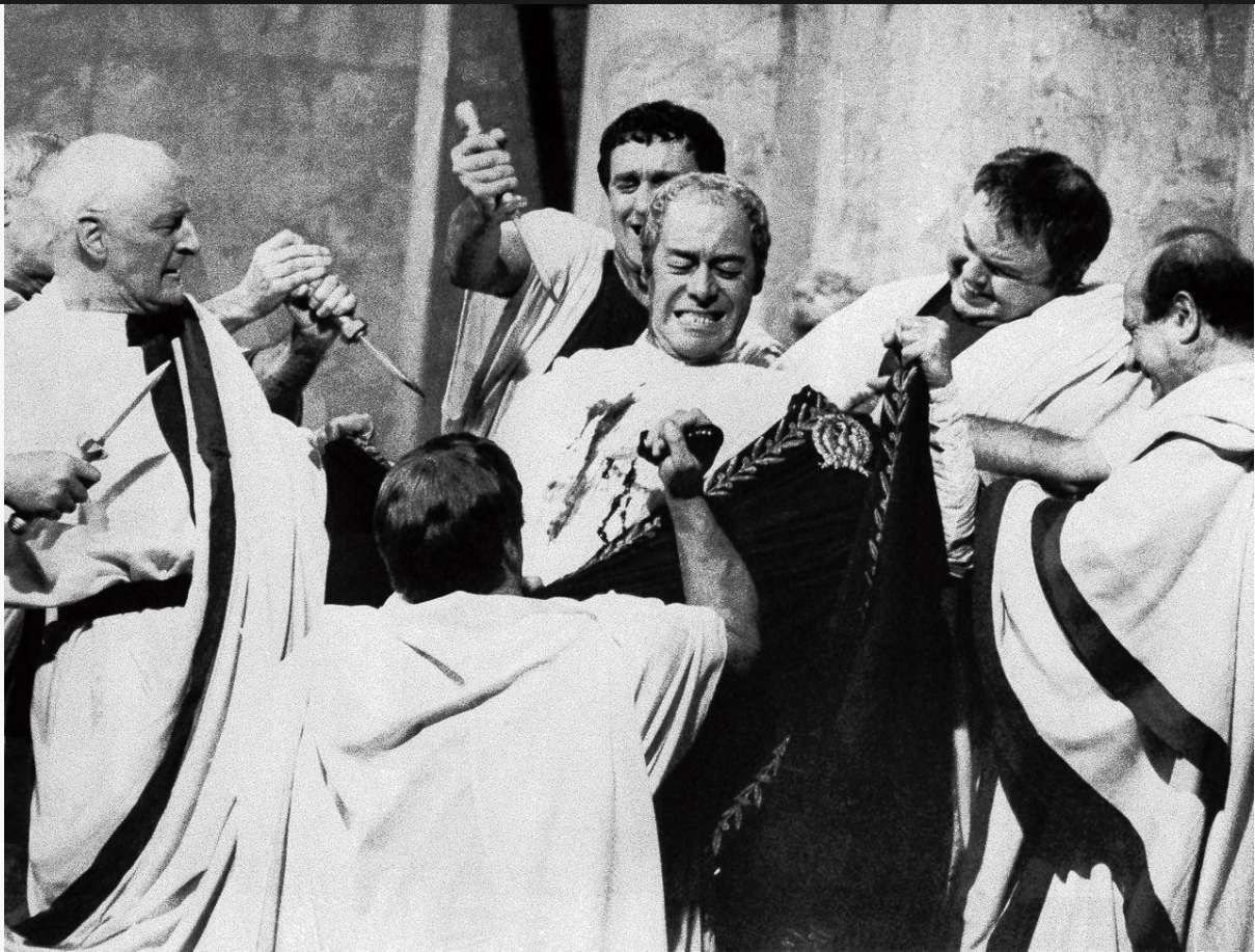
In de film Cleopatra vertolkt Rex Harrison Julius Caesar, die in de Senaat wordt vermoord. Foto uit de speelfilm Cleopatra

Oude geschiedenis De Brit Peter Stothard schreef een spannende geschiedenis over de moordenaars van Julius Caesar door de ogen van een van hen: Cassius Parmensis.