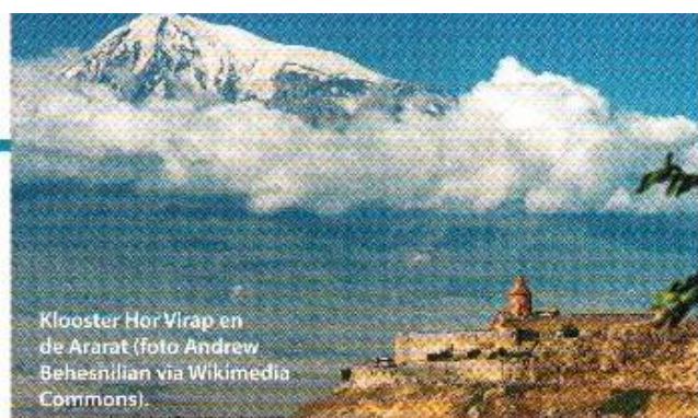
Klooster Hor Virap en de Ararat.

Leidende Armeense geestelijken hingen de één-natuurleer aan en trokken zich uit de moederkerk terug toen op het Concilie van Chalcedon (451) de twee-naturenleer tot dogma van de (katholieke) kerk werd verheven. Sindsdien is de Armeense kerk een autocefale kerk, die zichzelf bestuurt en niet van de moederkerk afhankelijk is en de liturgievieringen in de eigen taal houdt. Anders dan bij de katholieken mogen Armeense priesters getrouwd zijn, al moet hun huwelijk