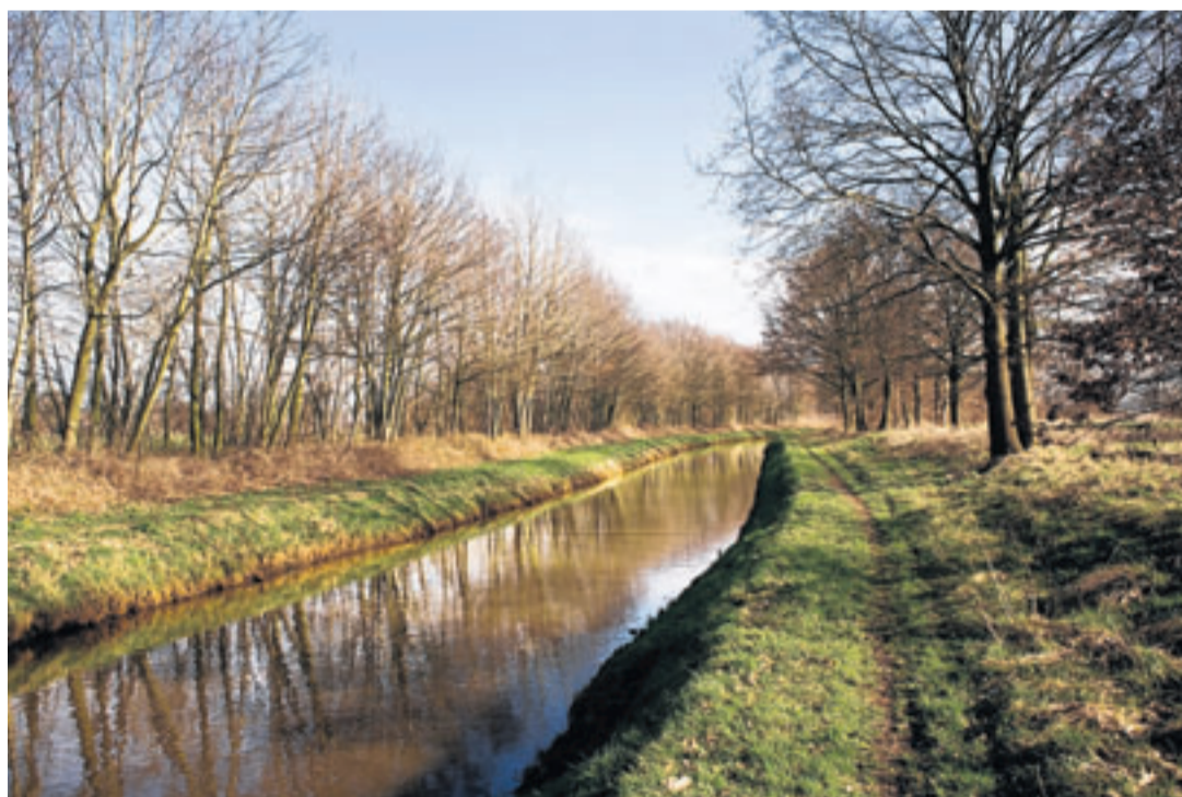
Het riviertje De Regge, tussen Twente en Salland.