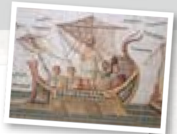
Odysseus geketend aan de mast bij de tocht langs de Sirenen, detail van een mozaïek uit Dougga rond 260 n.Chr.