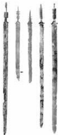
▲ Enkele zwaardfragmenten uit de late ijzertijd, afkomstig uit Kessel.

Begin december j.l. besloot de Tweede Kamer tot het instellen van een nationaal fonds voor archeologie. Het fonds is bedoeld voor de uitwerking en presentatie van bijzondere archeologische vondsten van (inter)nationaal belang. Archeologen zien dit als een overwinning, ze hebben een maandenlange lobby gevoerd om dit fonds te krijgen. Het fonds moet een oplossing bieden voor gevallen waarin bij opgravingen zulke bijzondere vondsten aan het licht komen dat er te weinig geld is om een opgraving goed uit te werken en te presenteren. De nationale archeologie dreigt dan het slachtoffer te worden. De archeologische beroepsgroep wil graag meedenken bij het verder vormgeven van dit fonds. ◀