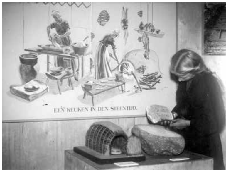
▲ Een meisje bekijkt de reconstructie van een maalsteen op de expositie 'Wat de aarde bewaarde' in Assen in 1943.

De voortdurende zorg over de veiligheid en het beheer van de collectie weerhield de directie van het museum er toch niet van om nieuwe activiteiten te ontplooiën. Zo ontstond nog in 1940 een plan voor een complete renovatie en zelfs gedeeltelijke nieuwbouw voor het museum. In opdracht van Van Wijngaarden ontwierp de architect Kortensbach een nieuwe voorgevel voor het museum. De witte gestucte gevel die uit de 19 e eeuw stamde zou moeten wijken voor een bakstenen façade in Hollandse renaissancestijl.