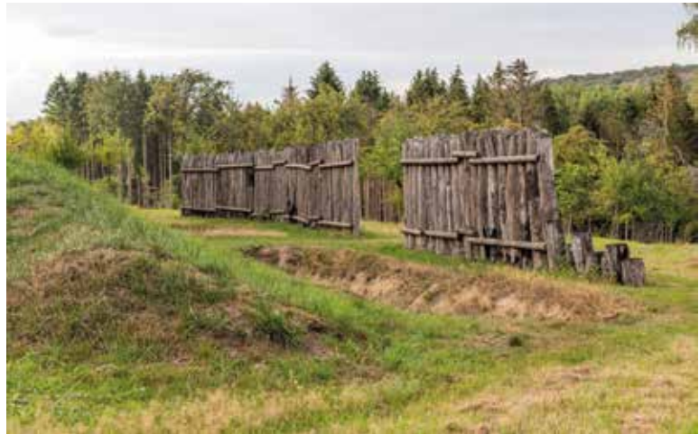
▲ Palissade bij wachttoren I/8.