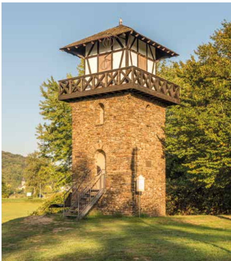
▲ Reconstructie van wachttoren I/1 aan de oever van de Rijn bij Rheinbrohl, het begin van de Obergermanisch-Raetische Limes.

Aan de Oostoever van de Rijn bij Rheinbrohl begon de Obergermanisch-Raetische Limes, een ruim zeshonderd kilometer lange, versterkte landsgrens die de Rijn met de Donau verbond. De eerste 75 kilometer daarvan doorkruiste de huidige deelstaat Rheinland-Pfalz. Alleen al op dit korte stuk bevonden zich tientallen wachtposten en een aantal versterkte legerplaatsen. Zowel de grens zelf - een aarden wal versterkt met een houten palissade - als wachtposten en andere verdedigingswerken zijn ook nu nog in het landschap zichtbaar.