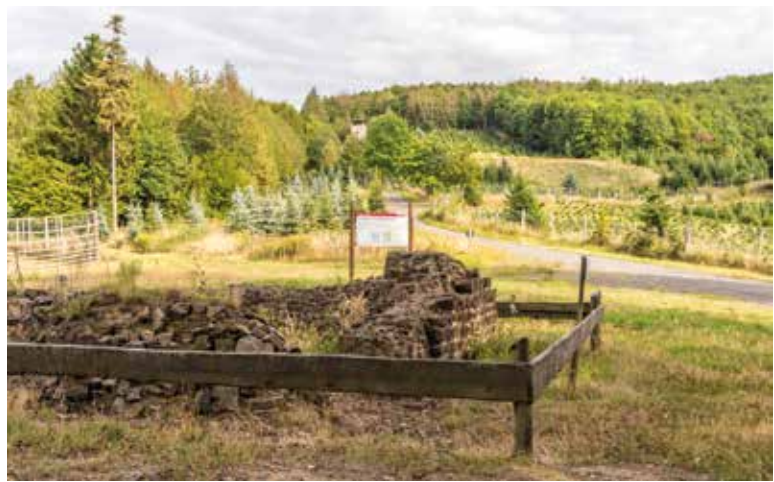
▲ Wachttoren I/9 gezien vanaf wachttoren I/8.