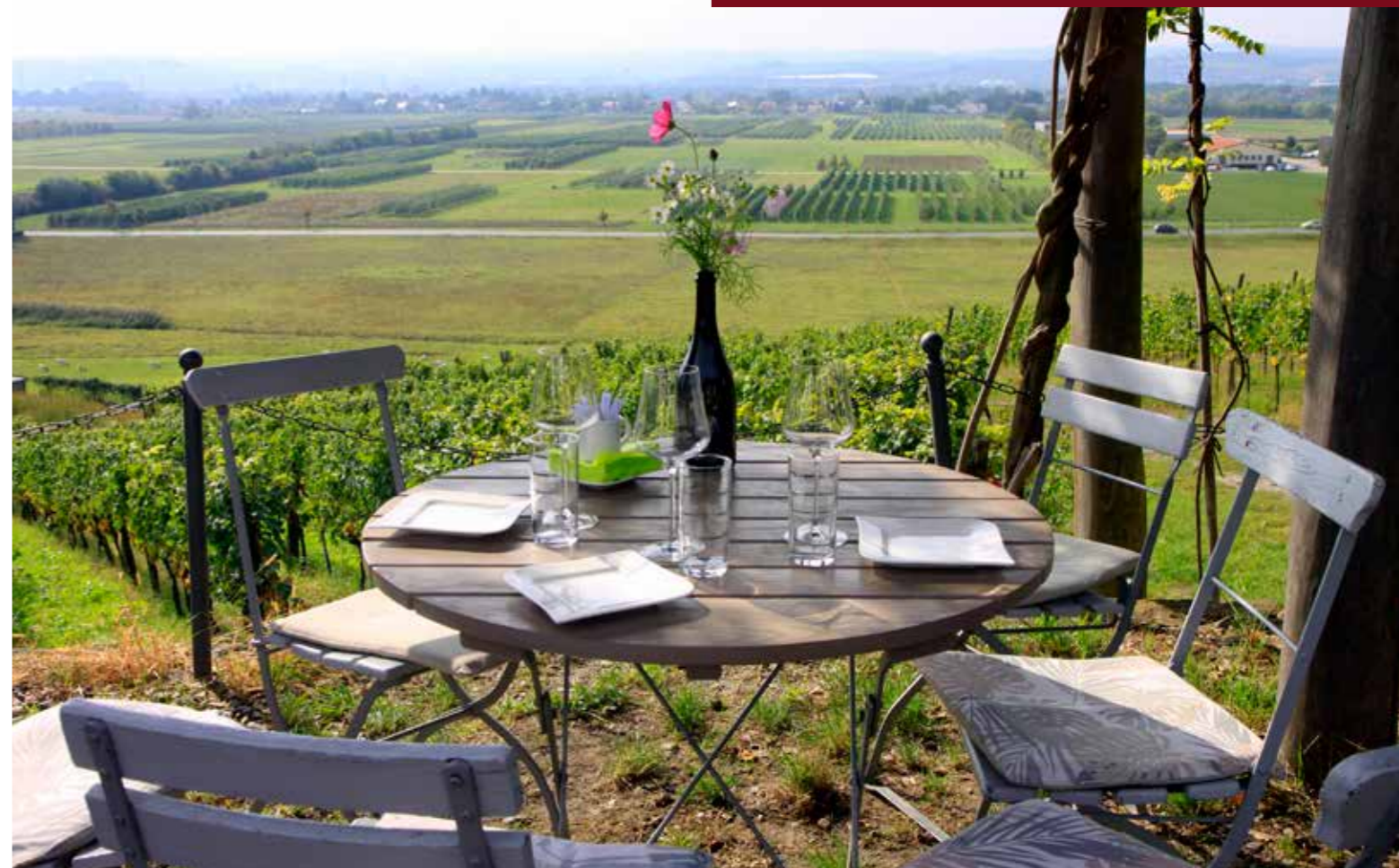
▲ Even lunchen met uitzicht op de wijnranken van wijndomein Klaus Zimmerling.