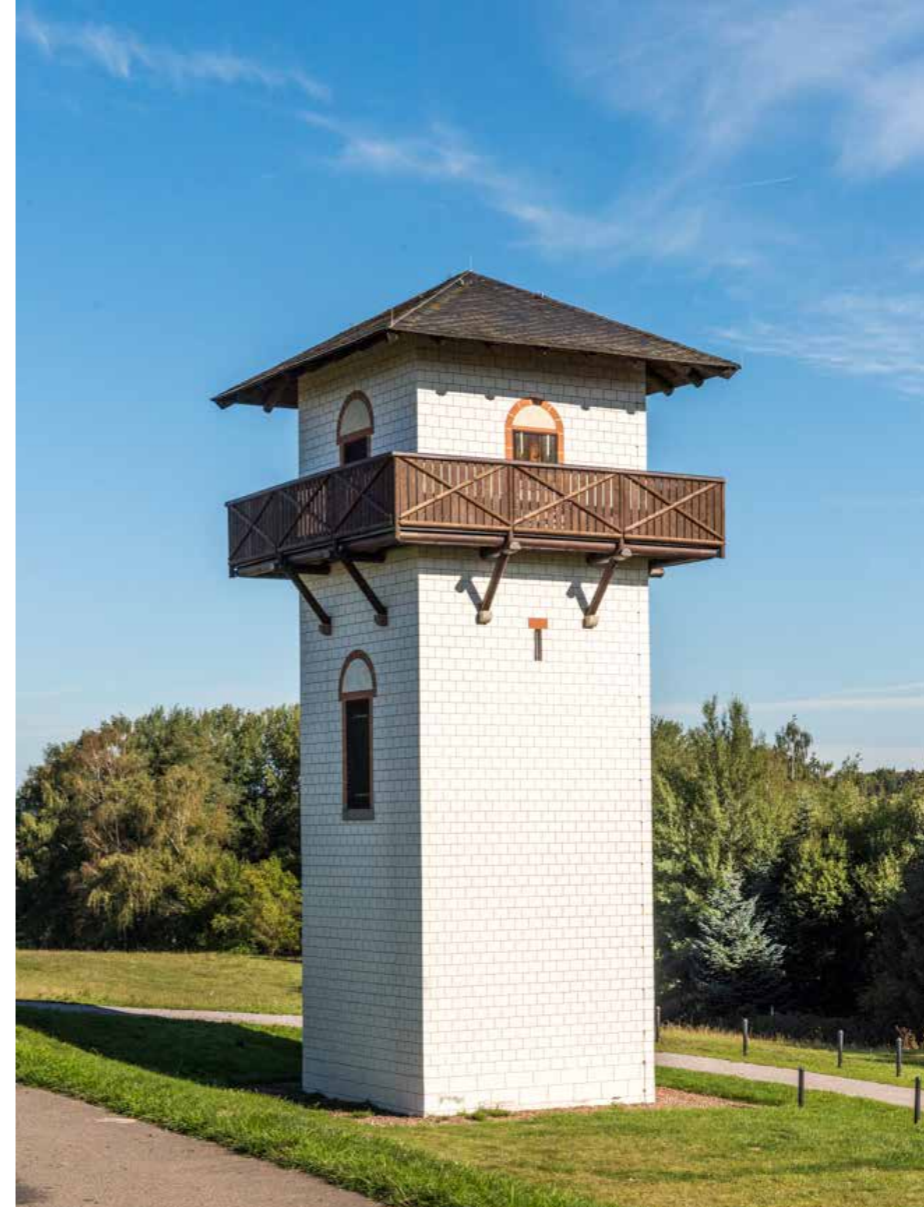
◀ Limespavillioen Hilscheid.

Vlak bij een oude watermolen gaat de route over een snelstromende beek. Van de brug waarmee de Romeinen deze beek gepasseerd moeten hebben – hij stroomt hier zo snel dat het onwaarschijnlijk lijkt dat ze er doorheen hebben gewaad – is nooit iets teruggevonden. Dat brengt ons op een andere vraag waarop geen antwoord lijkt. Hoe hebben de Romeinen zich langs de grens verplaatst? Op een paar plekken lijkt het of er achter de wal een soort van weg gelopen heeft. Maar op de meeste plaatsen ontbreekt elk spoor daarvan. Bij het iets verderop gelegen Hilscheid valt ons nog iets op. De reconstructie van een