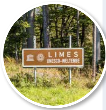
▲ Dit bord vertelt je dat je de originele Limes kruist.

Een van de laatste en grootste Romeinse aandachtspunten vormt het fort van Pohl. Dit fort is helemaal gereconstrueerd en in het interieur is een klein informatiecentrum ingericht. Het fraaie, in een dicht dennenbos gelegen fort van Holzhausen tenslotte ligt pal op de grens van de Bundesländer Rijnland-Palts en Hessen. Wie dan nog niet genoeg heeft kan nog wel even doorwandelen. Er volgen nog ruim zeshonderd kilometers en vele tientallen Romeinse ruïnes en reconstructies voordat je uiteindelijk bij de Donau bent. Daar eindigt de Limes Wandelweg. Maar voor ons zat het er voorlopig op. ■