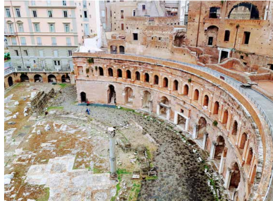
➤ Markten van Trajanus. (IV)

tempel kwam staat iets verderop op de Piazza Minerva. Deze in opdracht van Domitianus zelf uit Egypte gehaalde obelisk stond ooit voor de Isistempel en werd in 1665 door monniken teruggevonden in de tuin van het klooster van de Basilica di Santa Maria Sopra Minerva. In opdracht van de Paus ontwierp de beroemde beeldhouwer Bernini de sokkel in de vorm van een olifant.