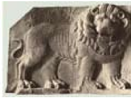
De zandstenen stèle van de Leeuwenhoroscoop, westelijke terras Nemrud. Links een kleurenreconstructie (Herman Brijder, 2012) en rechts een gipsafdruk gemaakt door Karl Humann & Otto Puchstein in 1883 (thans in Berlijn, Vorderasiatisches Museum, foto: Karl Humann, 1883).

ons onderzoek merkte ik dat er (te) veel zaken zijn gezegd zonder dat daar de bewijzen voor waren. En dat er door de archeologen die in de loop van anderhalve eeuw op de berg actief waren zaken verkeerd zijn aangepakt. Beelden zijn slecht gerestaureerd of gewoon vernield, constructies zijn aangepast op basis van totaal verkeerde hypothesen en in hun pogingen om het zo felbegeerde graf van Antiochos te vinden zijn er op allerlei plaatsen lukraak gaten in de berg gemaakt. Men heeft in een ultieme poging om de toegang tot het graf te vinden zelfs dynamiet gebruikt.'