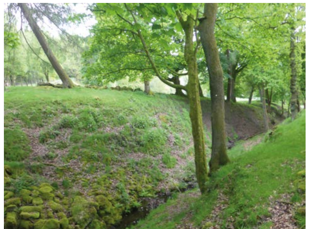
▶ De gracht van de muur bij Seabeg Wood.

een nog maar 15 jaar eerder opgeleverde, enorme stenen en volledig uitgeruste verdedigingsmuur: de muur van Hadrianus. Onder historici doen verschillende theorieën de ronde. Zo zou Antoninus Pius de veldtocht en de bouw van de muur hebben aangegrepen om zijn status als nieuwe keizer te bevestigen. In tegenstelling tot zijn voorgangers had hij namelijk geen enkele militaire ervaring opgedaan toen hij in 138 vrij plotseling tot keizer werd uitgeroepen. Een andere goede reden kan zijn geweest dat een aantal lokale stammen die ten noorden van Hadrianus' muur leefden en een verbond hadden gesloten met de Romeinen (zogenoemde confederati) zich na de dood van Hadrianus bedreigd voelden door de Caledoniërs en de Picten, stammen die nog noordelijker leefden die regelmatig strooptochten hielden ten zuiden van hun stamgebied. De nieuwe muur zou dan gediend hebben om de Romeinse confederati beter te kunnen beschermen.