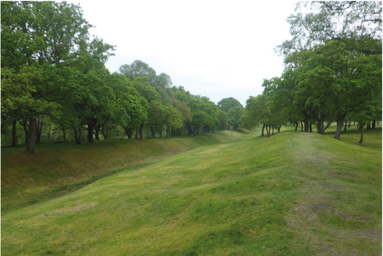
▲ Contouren van de Antonine Wall (de Muur van Antoninus Pius).