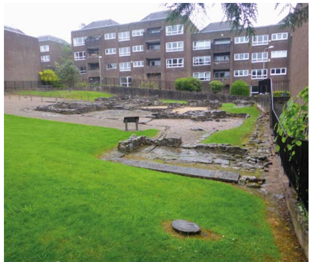
▶ Fundering van het badhuis in Bearsden.