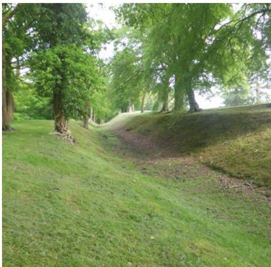
◀ De muur bij Rough Castle.