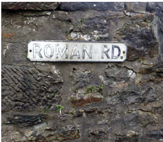
◀ In Bearsden volgt de hoofdstraat het tracé van de Romeinse weg.