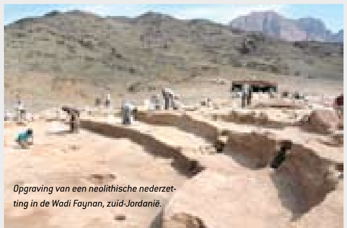
Opraving van een neolithische nederzetting in de Wadi Faynan, zuid-Jordanië.