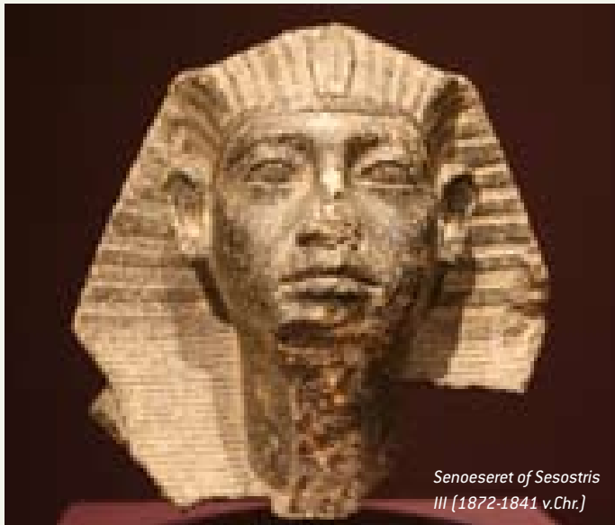
Senosert of Sesostris III (1872-1841 v.Chr.)

Rijk met zijn machtige koningen, enorme tempels en fabuleuze rotsgraven waren al veel vaker onderwerp van grote tentoonstellingen. De korte bloeiperiode die daartussen in lag - niet geheel verbazingwekkend het Midden Rijk genoemd - kwam er tot nog toe in de grote musea echter bekaaid van af. Daar wilde men in Lille verandering in brengen.